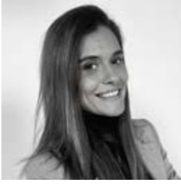
Jean Louis David